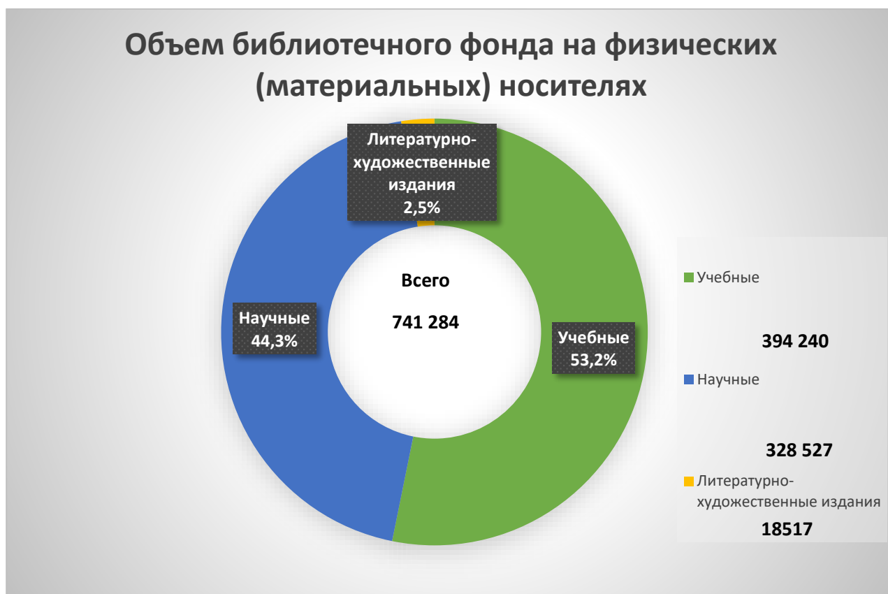
Рисунок 3. Объем библиотечного фонда на физических (материальных) носителях (экз.)

Учебная и научная литература приобретает только по заявкам кафедр, все приобретаемые документы в фонд библиотеки сверяются с Федеральным списком экстремистских материалов. Источниками поступлений литературы служат ведущие издательства страны и издательско-полиграфический комплекс университета, из которого было получено в 2023 году 3347 экз., что составляет 49,6% от всех изданий, поступивших в библиотеку на физических носителях.