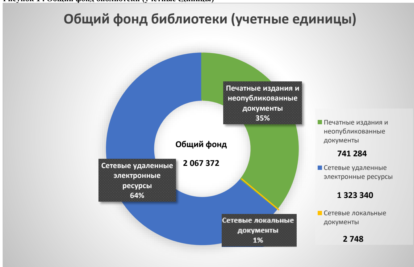
Рисунок 1 . Общий фонд библиотеки (учетные единицы)

Библиотечный фонд формируется в соответствии с профилем университета, требованиями федеральных государственных образовательных стандартов. На 01.01.2024 года в библиотеке университета общий объем фонда составил 2 067 372 учетных ед., из которых: 1 326 088 электронных учетных единиц, 741 284 экз. печатных изданий и неопубликованных документов.