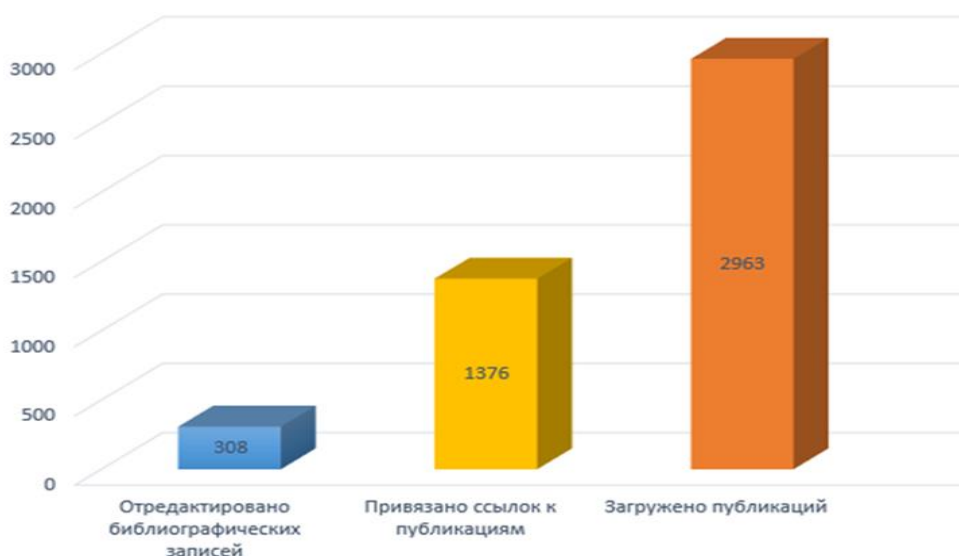
Рисунок 4. Виды деятельности библиотеки по сопровождению научно-публикационной активности профессорско-преподавательского состава вуза в НЭБ eLIBRARY в 2023 г.

При необходимости проводится консультирование НПП о работе с персональным профилем автора и самостоятельного корректирования списков своих публикаций и цитирований в РИНЦ.